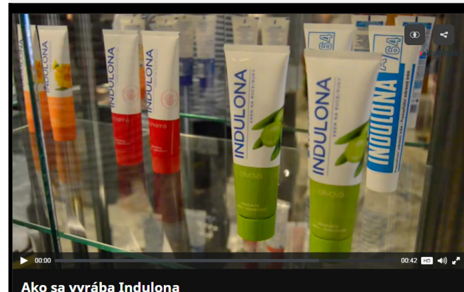
Ako sa vyrába Indulona

Na Slovensku azda nie je domácnosť, kde by nebola. Pamätáme si ju ako krém na oparovanie aj po ňom. Mamičky na ňu nedajú dopustiť a niektorí si ňou natierajú tvár dňom. Aí keď je určená predovšetkým na ruky