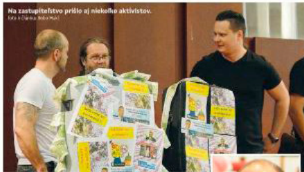
Na zastupiteľstve prišlo aj niekoľko aktivistov.

Poslanci veľkú časť predaj akcií spoločnosti Wood Waste Management Ltd. Ako rozumní akcionári spoločnosti KOSIT si v súdži, kde boli približne ďalšie dve firmy, uplatnili preskupenie práv na 29 percent akcií za cenu 4,6 milióna eur.