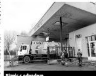
Biznis s odpadom. Kosit chce znovu získavať zisk z odpadových služieb.

KOSICE. Po zrušení tenderu a nemi, že Kosit akcionári čosiaľ v súkromí podiely v troch odpadových spoločnostiach Ozon, Ozor, Duteko a MTE. Pôvodný výnos bol 20 mil. H by by opäť bol 20 mil. akcionári Kositu sa snažia získať späť svoje podiely v týchto firmách. Kosit chce získať späť svoje podiely v týchto firmách. Kosit chce získať späť svoje podiely v týchto firmách.