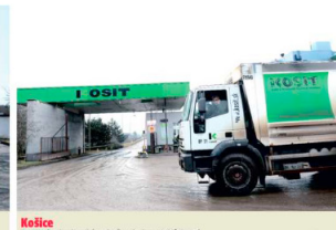
Košice Tam Košíc odpadá papajka, v Prešove by mal skládovať.