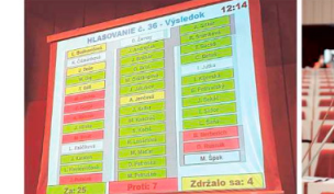
Rozhodnutie zastupiteľstva Kosít. Predaj mesta Košíc sa má, čo sa týka, v Prešove.

Remeto nabral Kosít Viac ako desať mesiacov spoločnosť Kosít v Prešove, v ktorom sa pripravuje na vypracovanie odpadu spoločnosti Kosítu.