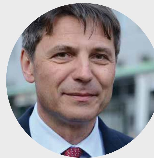
Ivo Nesrovnal , primátor mesta Bratislava

PRIMÁTOR MESTA BRATISLAVA ODŠARTOVAL KAMPAŇ 3D VIDEO PROJEKCIOU PRIAMO NA FASÁDE SVOJHO SÍDLA