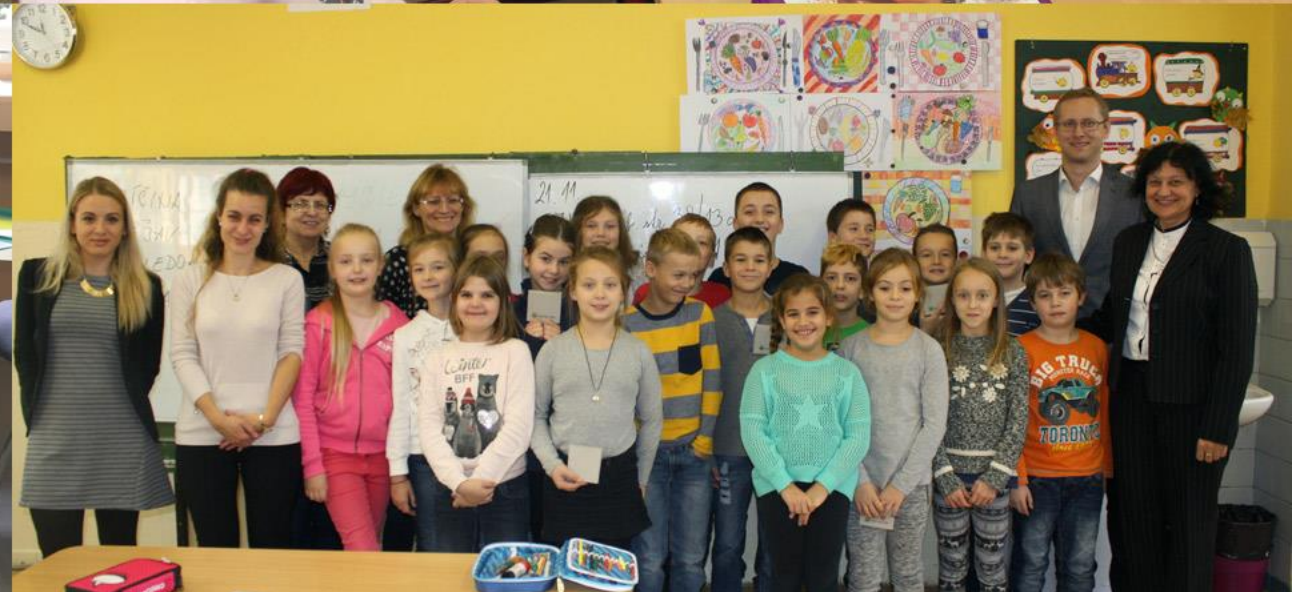
ZŠ Beňovského 1, Bratislava – november 2016