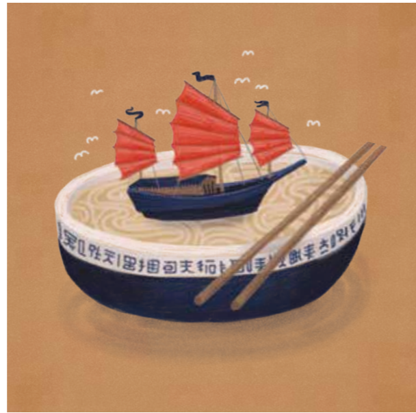
Ilustrácie nachádzajú svoj základ v symboloch Ázie, ktoré sú pochopiteľné aj pre Európana.