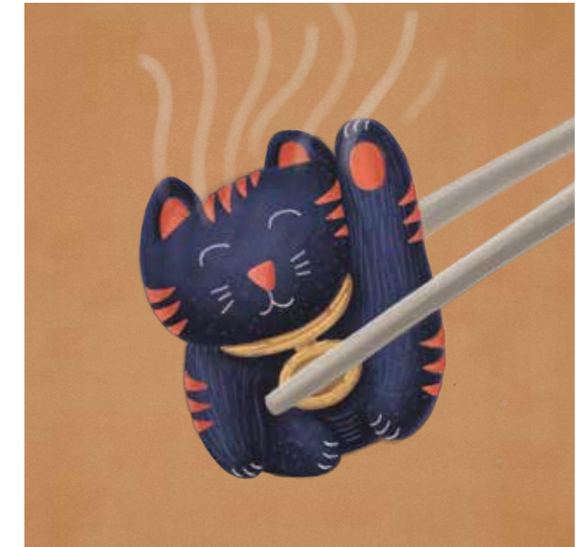
Ilustrácie sú komponované tak, aby sa dali navzájom kombinovať.