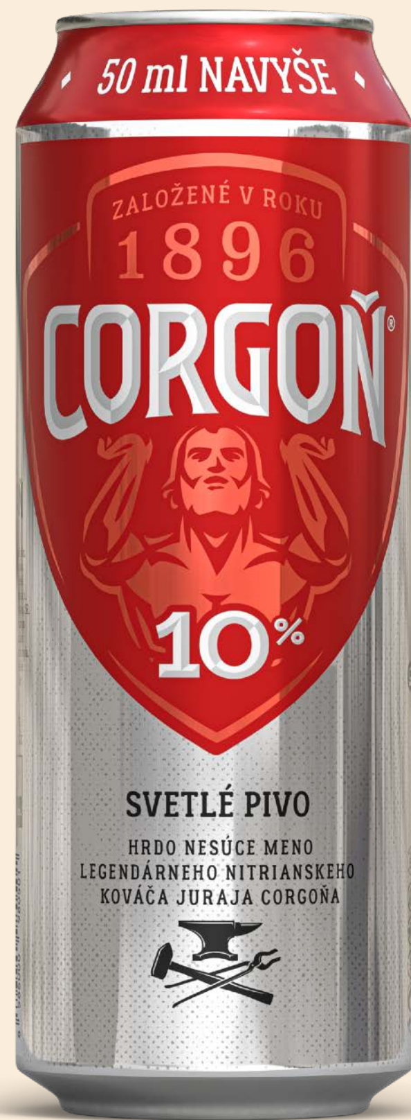
Svetlé pivo 10%, plechovka 550 ml