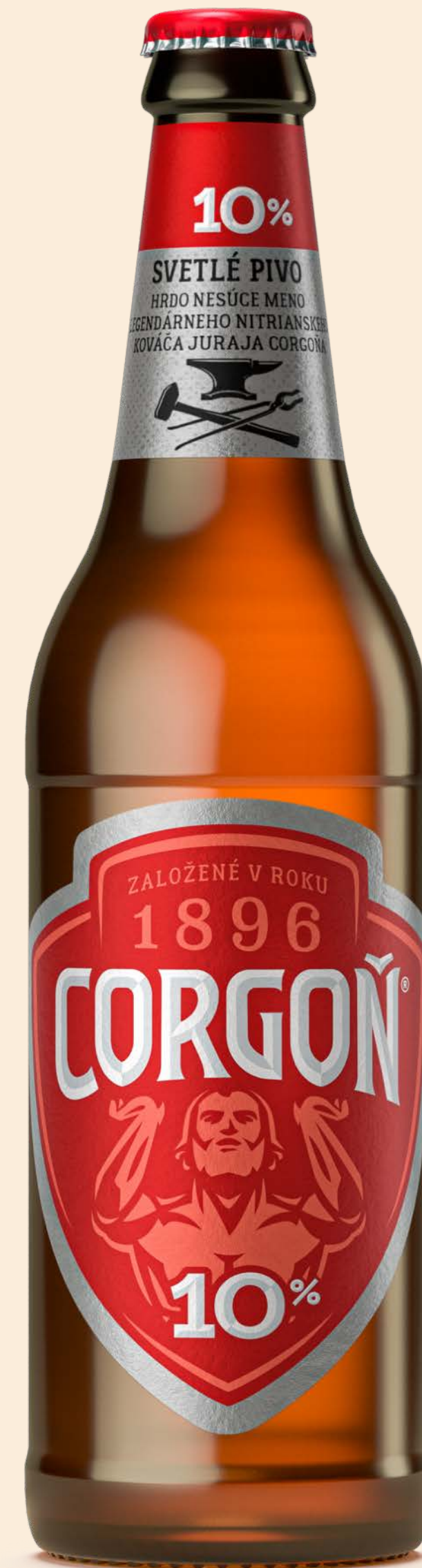
Svetlé pivo 10%, flaša 0,5 l