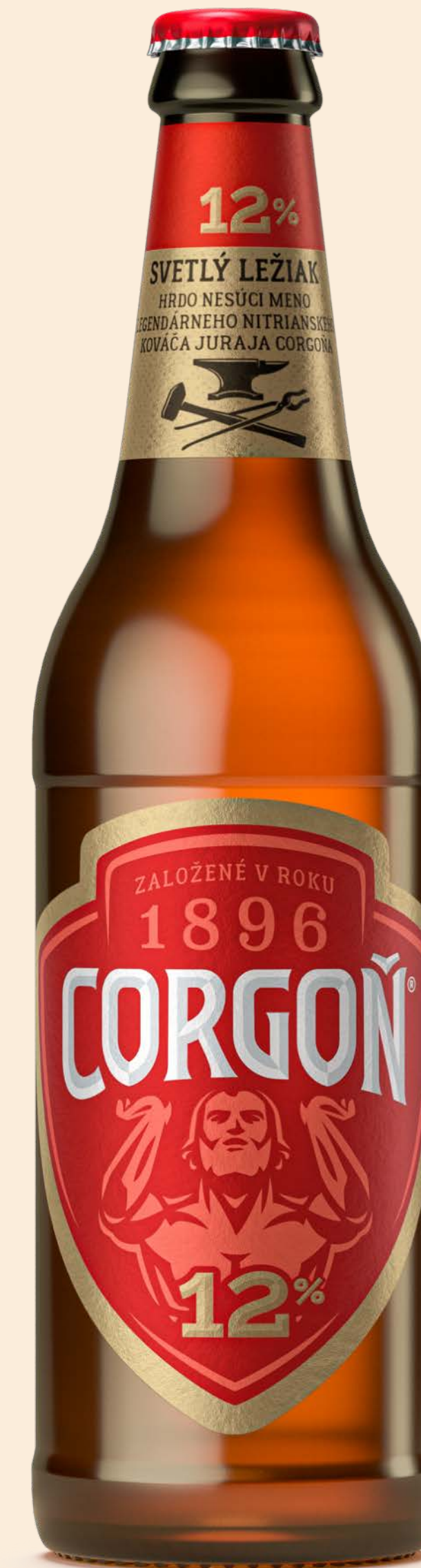
Svetlý ležiak 12%, flaša 0,5 L