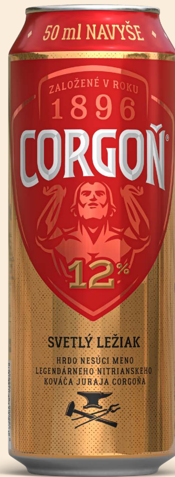
Svetlý ležiak 12%, plechovka 550 ml