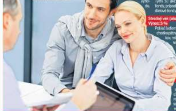
Prí investovaní financie zhodnotíte, pri bežnom sporení vám nezarobia.