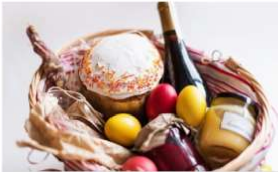
Naturalná víniča.

Štatistiky hovoria, že na tieto sviatky míňame od 100 do 200 eur.