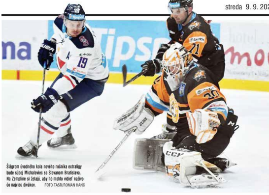
Šliagram úvodného kola ročníka extraligy bude súboj Michaloviec so Slovanom Bratislava. Na Zemplíne si želajú, aby ho mohlo vidieť najmä čo najviac divákov.

Novú sezónu odštartujú Slovan Bratislava a Michalovcami.