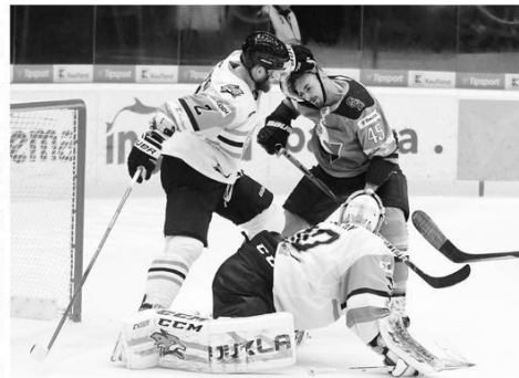
Ambiciózne Michalovce odštartujú novú sezónu súbojom s bratislavským Slovanom.

Trojnásobný šampión a víťaz základnej časti nedokonenej sezóny 2019/20 Banská Bystrica bude hrať pre rekonštrukciu svojho zimného štadióna domáce zápasy vo Zvolene.