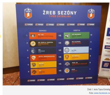
Žreb 1. kola Tipos Extraligy.