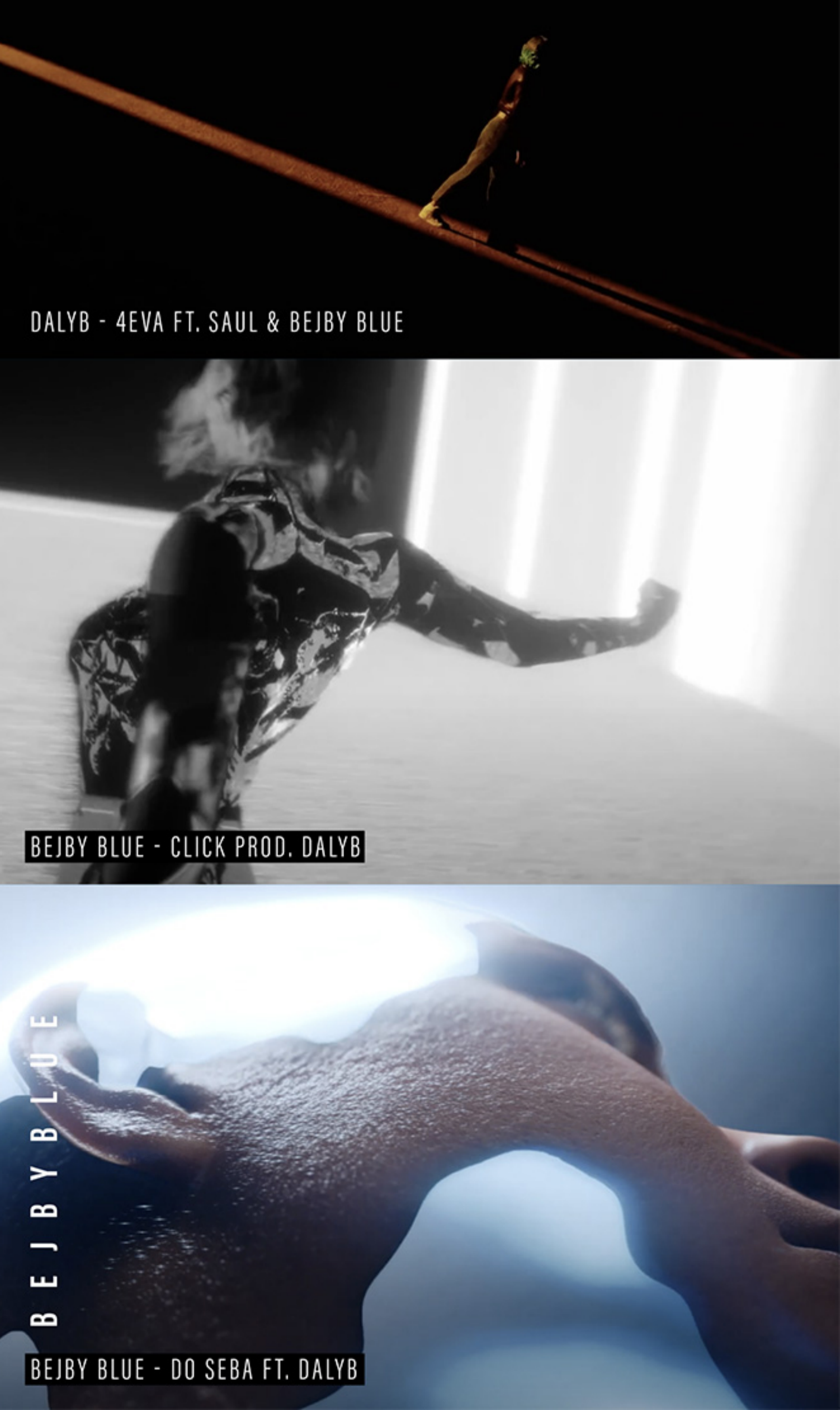
DALYB - 4EVA FT. SAUL & BEJBY BLUE