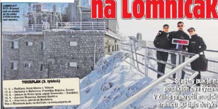
TOURPLAN (3. týždeň) 11. 4. – Prieštav, Nemecko 12. 4. – Banská Bystrica, Slovensko 13. 4. – Banská Bystrica, Slovensko 14. 4. – Banská Bystrica, Slovensko 15. 4. – Košice, Slovensko Viac o šťastnom puku sa dočítate na www.sportnet.sk