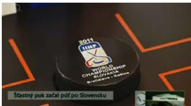
Šťastný puk začal púť po Slovensku