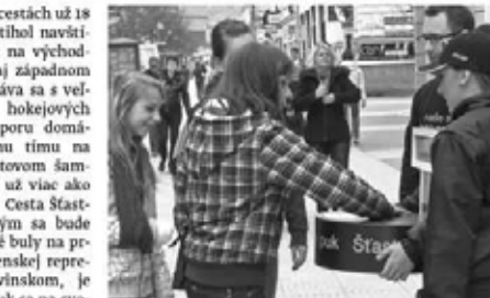
Mohli si naň siahnuť Prinesie šťastie našej hokejovej reprezentácii

Poprad. Jednou z akcií podporujúcich hokejové majstrovstvá sveta, ktoré sa budú hrať v Bratislave, je aj kliknutie na šťastný puk. Fa Bratislava víť a kliknutie na šťastný puk je na cestách už 18 a obci, dní. Počas nich stihol navštíviť púť viacero miest na východe na vlastnom, strednom aj západnom moter slovensku a stretáva sa s veľkým záujmom hokejových priaznivcov. Podporu domácejmu hokejovému tímu na blížiacom sa svetovom šampionáte vyjadrilo už viac ako 70 000 fanúšikov. Cesta Šťastného puku, ktorým sa bude zhadzovať úvodné hry na prvom zápase Slovenskej reprezentácie so Slovinskom, je v plnom prúde. Puk sa na svojej ceste naprieč Slovenskom zastavil popri väčších mestách aj na viacerých kuriózných