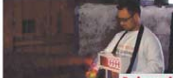
putuje po štyridsiatich dotykoch „Šťastného puku“, a pamätných miestach, ktoré v spomínanom období

PRIEVIDZA. Od piatka 25. marca až do 28. apríla môžu priaznivci na Slovensku svidieť emociu