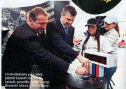
Z ľavého Šťastný puk, ktorý pokrŕil kockami ľadu, generálny manažér slovenskej reprezentácie Peter Šťastný.

„Je pre mňa čťou pokrŕiť tento puk a symbolicky tak ako prvý zažehať nášmu tímu šťastie na blížiacich sa majstrovstvách sveta v ľadovom hokeji. Páči sa mi spojenie Šťastný puk, lebo sa hovorí, že je lepšie byť šťastný ako dobrý...“ povedal bývalý kapitán a generálny manažér slovenskej reprezentácie PETER ŠTASNÝ, ktorý plní vo svojom rodnom meste úlohu hokejového ambasadora.