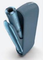
Cena: IQOS ILUMA: 69 EUR

Ľahšia verzia IQOS ILUMA vyzerá na prvý pohľad podobne ako IQOS 3 DUO, najbližšie sa výkľapko do strany a nahrieváč je dizajnovane rovnaký s prémiovým modelom. Čo sa týka náplní, zariadenie nie je kompatibilné so staršou verziou IQOS 3 DUO. IQOS ILUMA prichádza v piatich farebných spracovaniach: pebble beige, pebble grey, sunset red, azure blue a moss green.