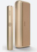
Cena: IQOS ILUMA PRIME: 119 EUR

Na rozdiel od pôvodného modelu IQOS ILUMA PRIME neopakuje dizajn puadler staršej generácie – zariadenie nemá žiadne západky ani výkľapkové časti. Hliníkové puadro je elegantne zabalené do magnetického vymeniteľného krytu, ktorý je podobný tabakovej. Ten bezpečne zakryje nahrieváč za ním. Okrem toho, že sa dá ľahko ľahko vymeniť, môžete si zvoliť dizajnovanú látkovú koženkovú alebo textilnú verziu. IQOS ILUMA PRIME má tvisi hlavné farby: gold khaki, obsidian black, jade green a bronze tape.