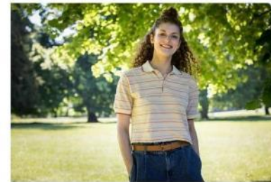
Ako vyzerá dievčatko z vianočnej reklamy?