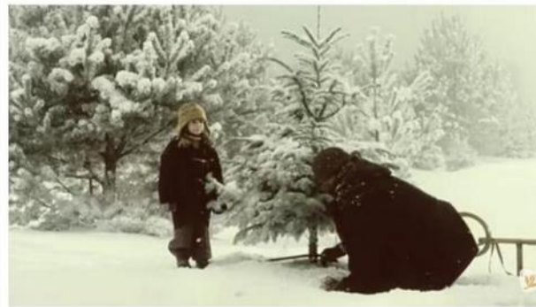
Známa vianočná reklama.

Reklamu nakrúcali v roku 2003 v lese pri meste Mladá Boleslav. Otec sa vyberie s dcérou do lesa po vianočný stromček. Idúly prekážajú diviák s veľkými zahnutými zubami dohora, pred ktorými musia ujsť.