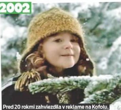
Pred 20 rokmi zahviezdila v reklame na Kofolu.