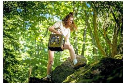
Po 2 dekadach je opäť tvárou spotu identickej značky.

Sandra mala vtedy 3 roky a ako sama vravi, veľa si z natáčania nepamätá. Teraz ju však čaká veľký návrat na televízne obrazovky. A ako inak, opäť v reklame na nealkoholický nápoj!