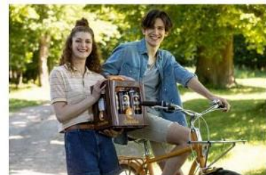
Ako vyzerá dievčatko z vianočnej reklamy?