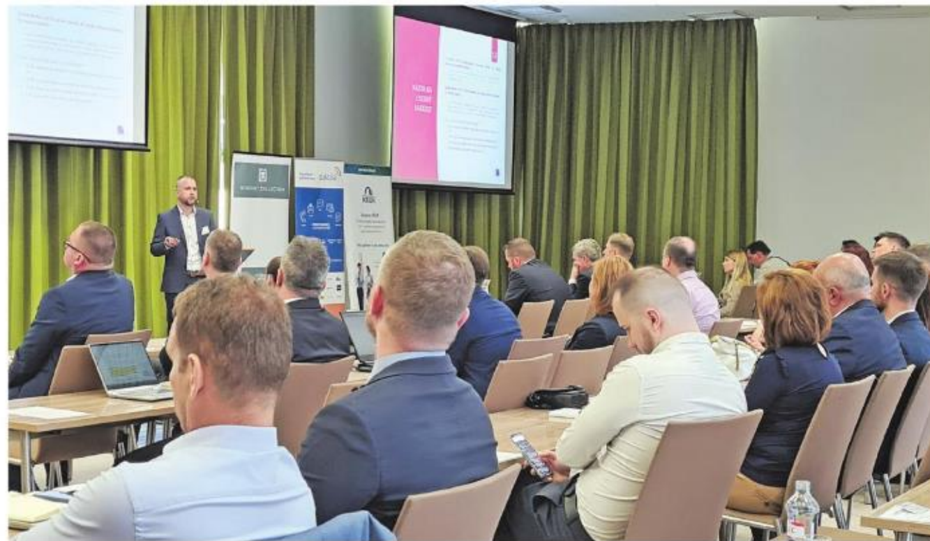
Verejná informácia o osobnom bankrote môže ovplyvniť vašu kreditnú históriu.