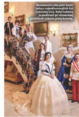
Korunovačná róba patrí medzi jedny z najkvalitnejších šiat cisárkovej Sissi. Hotel Lomnica ju predstavil pri slávnostnej príležitosti získania piatej hviezdy.