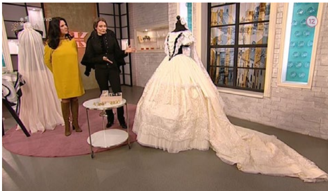
► Dámsky Klub, RTVS