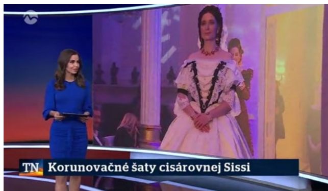
► Spravodajstvo, Markíza