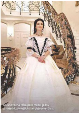
Korunovačná róba patrí medzi jedny z najkvalitnejších šiat cisárkovej Sissi.

Súčasťou hotela je rozsiahla zbierka viac ako 600 galerijných diel významných výtvarníkov, rozprávkový wellness a delikátna rakúsko-uhorská gastronómia vás svojou atmosférou doslova presunú na cisársky dvor. Kávu a fantastické jedlo a dezerty si môžete vychutnať v restaurácii Sissi, reštaurácii Franz, Jozef či v kaviarni Mozart.