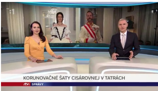
► Spravodajstvo, RTVS