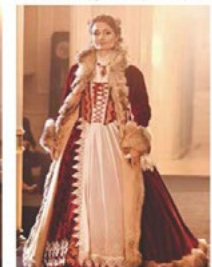
Päťhviezdičkový Hotel Lomnica je so zlatým vekom monarchie ešte spáty. Toto obdobie sa odráža v jeho architektúre, ale aj delikátny rakúsko-uhorskej gastronómii. Súčasťou hotela je rozsiahla zbierka vyše 600 galerijných diel významných výtvarníkov. Korunovačné šaty cisárkovej Sissi sa stali súčasťou tohto umeleckého zbierkového fondu a sú tak novým verejne dostupným klenotom Tatranskej Lomnice i celých Tatier. Viac informácií o výstave šiat nájdete na www.hotellomnica.sk .