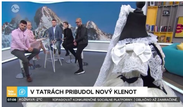
► Teleráno, Markíza