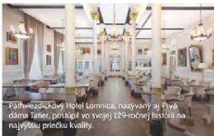
Päťhviezdičkový Hotel Lomnica, nazvaný aj Prvá dáma Tatier, postúpil vo svojej 129-ročnej histórii na najvyššiu priečku kvality.