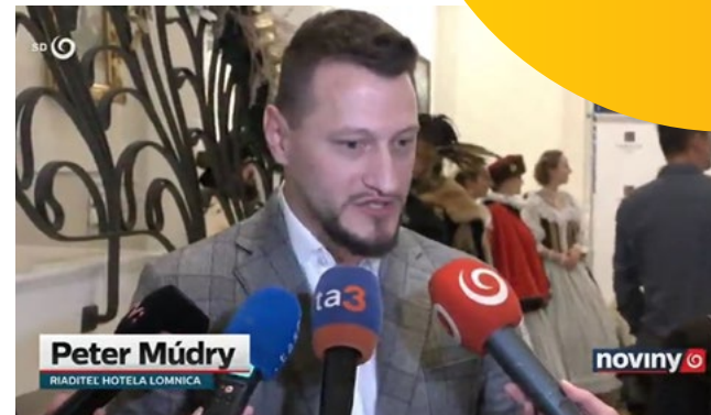
► Spravodajstvo, TV JOJ