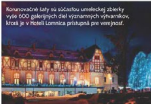
Korunovačné šaty sú súčasťou umeleckej zbierky vyše 600 galerijných diel významných výtvarníkov, ktorá je v Hoteli Lomnica prístupná pre verejnosť.