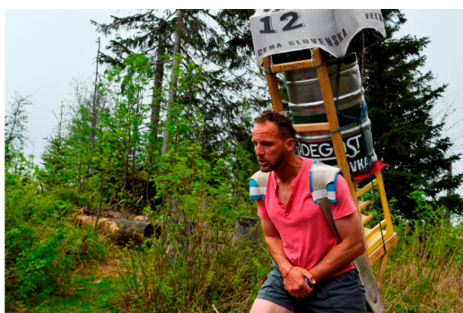
Stokilový náklad piva, dvestometrové prevýšenie, desiatky minút tvrdej práce pre vysokohorských nosičov. Legendárne nosičské preteky

2. Postoj.sk – Horskí nosiči sa vydajú s nákladom do nadmorskej výšky 1 475 metrov