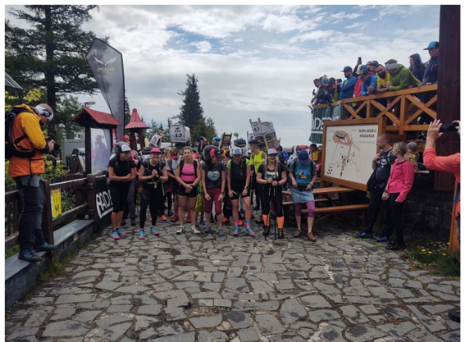
Nečakaná účasť: Na štart sa postavilo 33 nosičov a 9 nosičiek.