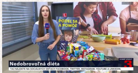
TA3 – Dobré správy Nedobrovoľná diéta