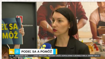
Markíza - Teleráno Podel sa a pomôž