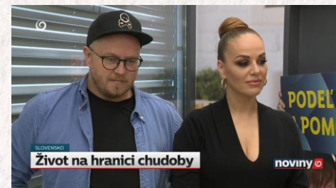
TV JOJ - Noviny Život na hranici chudoby